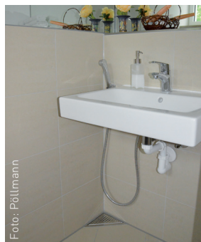
Auch auf kleinstem Raum kann hier geduscht werden.

Duschbereich: Ähnlich wie in einem Wohnmobil-Bad wird einfach die verbleibende Raumfläche zum Duschen benutzt. Das Wasser läuft in den (neuen) Bodengully ab. Die neue Waschtischarmatur kann als Duscharmatur genutzt werden. Die Toilette wird im Bedarfsfall als Sitz während des Duschens „zweckentfremdet“. Zum Schutz von Wand und Ausstattung wird ein Rundum-Duschvorhang an der Decke über ein leichtgängiges, auf die individuellen Maße gefertigtes Standard-Schienensystem installiert.